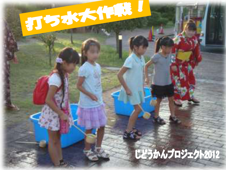
じどうかんプロジェクト2012