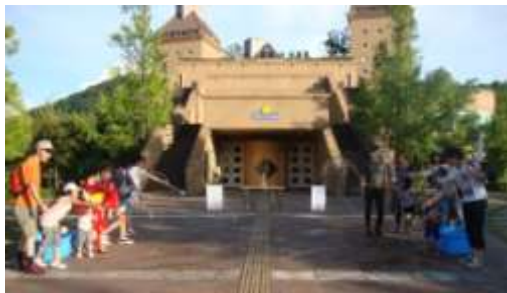
一斉に打ち水を行う