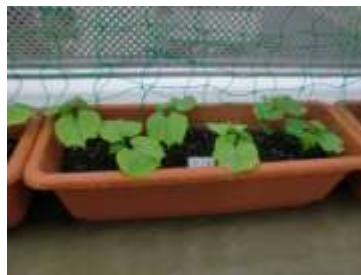
6月18日（月）葉が大きくなったよ