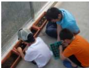
プランターに植え替え

5月25日に種植えをしてから1ヶ月。1つも枯れることなくどれも元気に育っている。どんどん蔓を伸ばして、大きな実がなるように、来館する子どもと一緒に水やりや世話をしていきたい。これからのゴーヤの成長が楽しみ！