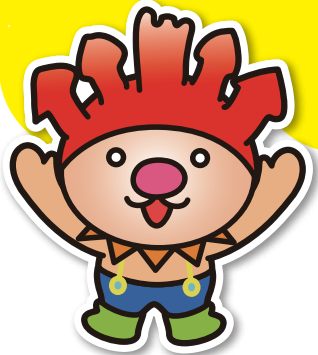
Mascot Character Koshiro 마스코트 캐릭터 고시로